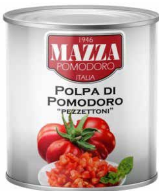
Konservuoti pomidorai pjaustyti 2,5 kg / 1,5 kg