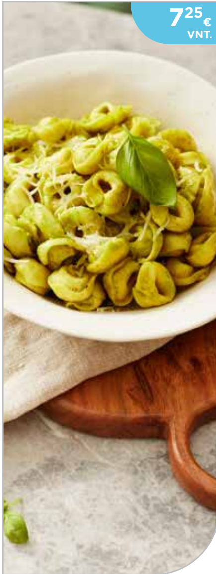
Torteloni su rikota ir špinatų kremu 6x1,5kg, šaldyti