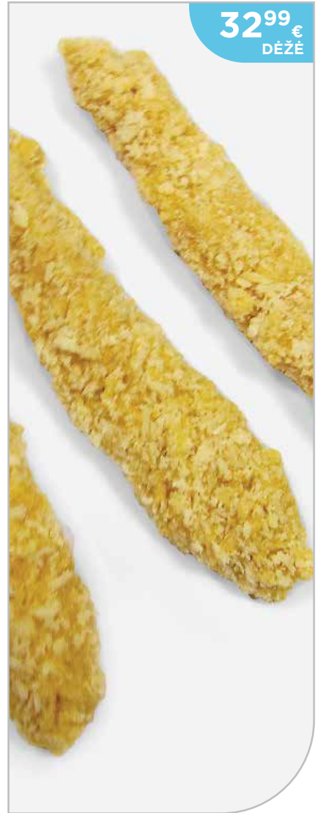
Vištienos lazdelės 3,3 kg, Kogus, šaldytos